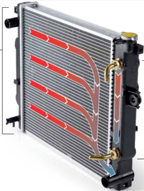
Enfriador de la transmisión